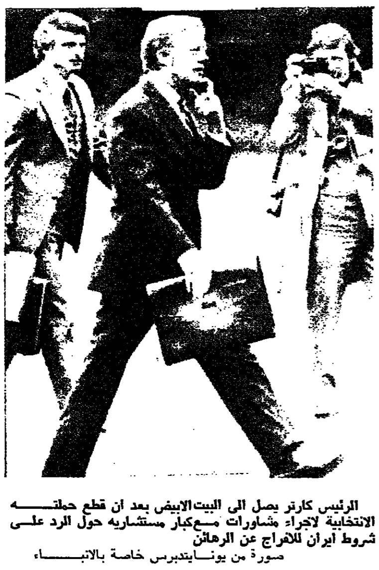
الرئيس كارتر يصل الى البيت الابيض بعد ان قطع حملته الانتخابية لاجراء مشاورات مع كبار مستشاريه حول الرد على شروط إيران للإفراج عن الرهائن

امارات الخليج ترغب في البقاء بعيدة عن النزاع العراقي - الإيراني البحرين - امارات الخليج - علم هنا ان حكومة الامارات العربية المتحدة قابلت بصمت مطلق النداء الذي وجهه اليها العراق بضرورة العمل على استعادة الجزر الثلاث ابو موسى وطنب الكبرى وطنب الصغرى من ايران . وهذا الصمت يشير الى ان الامارات المتحدة ترغب في ان تبقى بعيدة عن النزاع العراقي الإيراني الذي يدخل اسبوعه السادس وكان الدكتور سعدون حمادي وزير خارجية العراق قد التقى أمس الأول خطابا امام المجلس الوطني العراقي تحدث فيه عن تطورات الحرب بين العراق وإيران وطلب من الامارات العربية المتحدة ان تعمل على استعادة الجزر الثلاث في مدخل الخليج الفارسي ، ووعده البنية على ٢٤٨